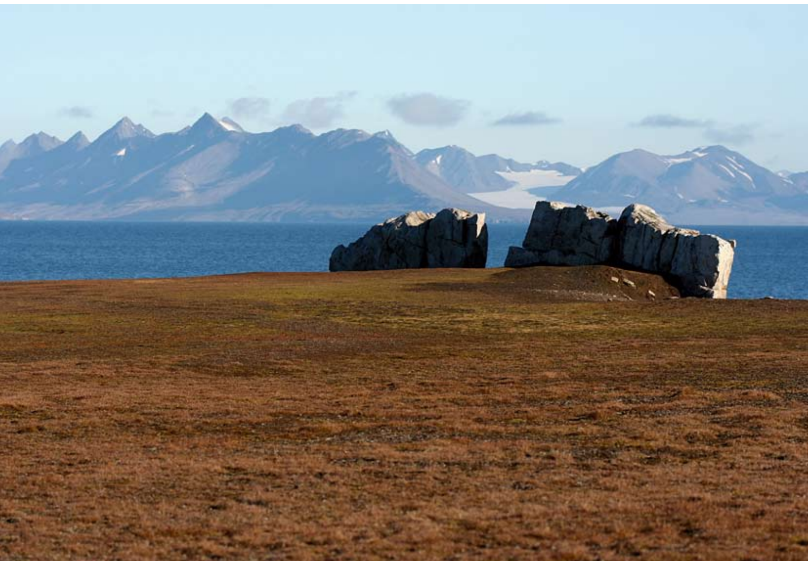
Festningen på Svalbard